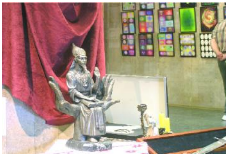
Император Унгхарт – источник Универсального Знания

Это наука, которая позволяет объективно описывать форму выражения смысловых категорий. А это позволяет говорить об объективности Внутренней природы "Я" человека. Эта наука исследует свойства алгоритмов знаковых структур, на основе которых такие "расплывчатые" науки как философия, этика, эстетика