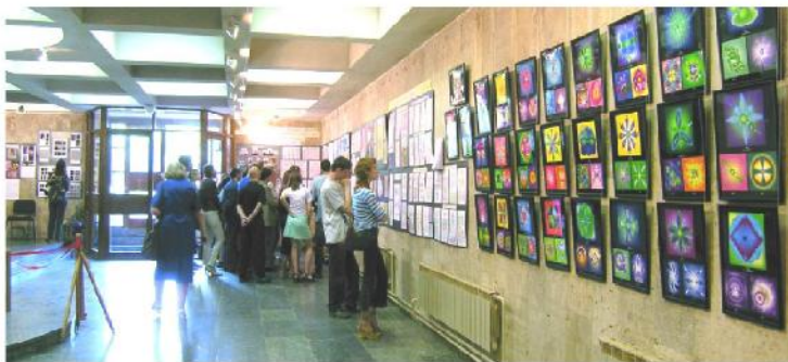
Выставка вызвала оживленный интерес у жителей Украины

чайно я оказалась в числе посетителей очень необычной экспозиции, выставочный материал которой, меня, человека совершенно неподготовленного, просто ошеломил. Ознакомившись с ним, я пережила двоякое чувство: с одной стороны то, что было мной увидено, не было похоже ни на что из того, что мне приходилось видеть ранее, а, с другой стороны, все, что я увидела, было знакомо мне с пелёнок. Просто я не догадывалась, что многие привычные для нас вещи таят в себе глубочайшую гармонию Единого замысла Творца. И что ключи этого познания находятся прямо (и именно!) у нас, жителей Украины, в руках. Единственное что нам остаётся сделать – это открыть ими сокровищницу Тайн Бытия.